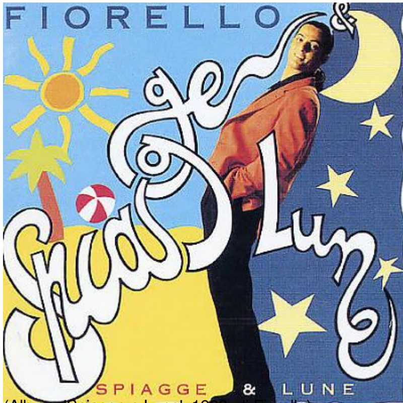
(Album "Spiagge e Lune", 1995, di Fiorello)