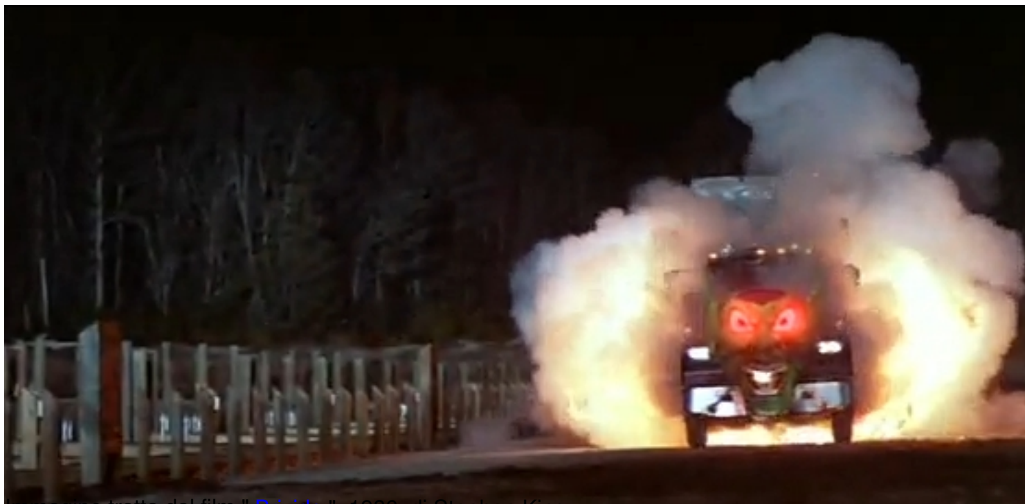
immagine tratta dal film " Brivido ", 1986, di Stephen King

Clicca qui sotto per vedere una galleria di poster e recensioni di film nella mia fan-page su facebook: