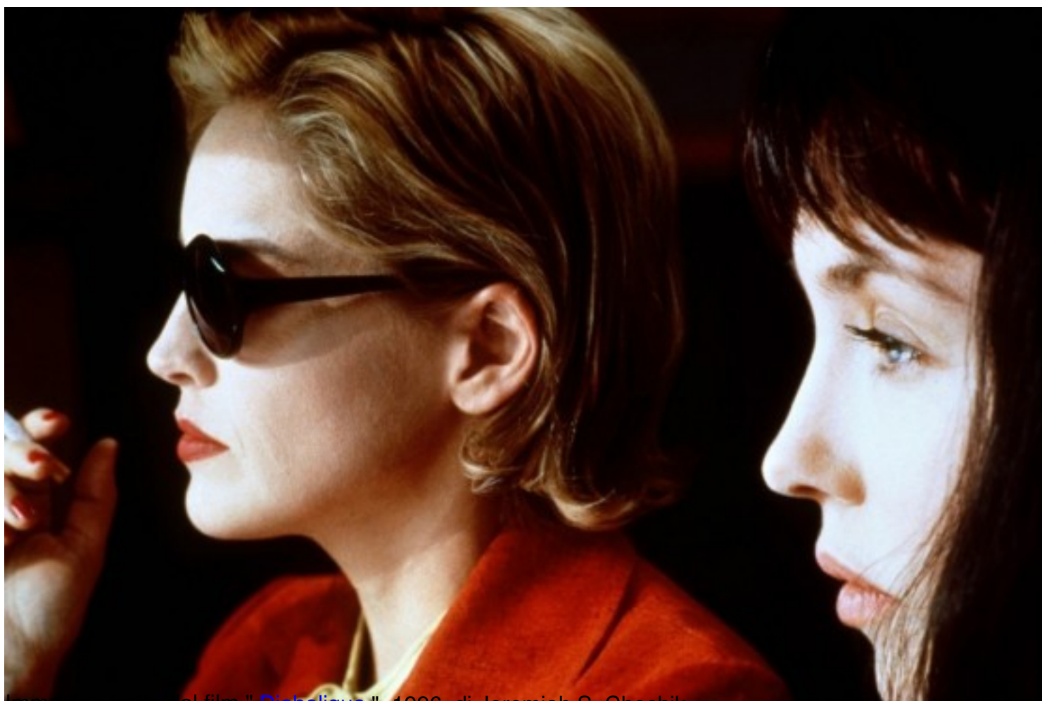
Immagine tratta dal film " Diabolique ", 1996, di Jeremiah S. Chechik

Clicca qui sotto per vedere una galleria di poster e recensioni di film nella mia fan-page su facebook: