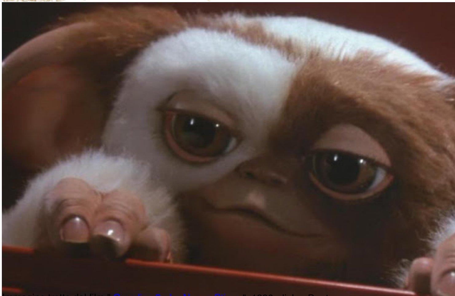
Immagine tratta dal film " Gremlins 2 - La Nuova Stirpe ", 1990, di Joe Dante

Clicca qui sotto per vedere una galleria di poster e recensioni di film nella mia fan-page su facebook: