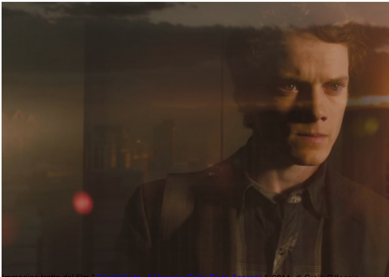
Immagine tratta dal film " Fright Night - Il Vampiro Della Porta Accanto ", 2011, di Craig Gillespie Clicca qui sotto per vedere una galleria di poster e recensioni di film nella mia fan-page su facebook: