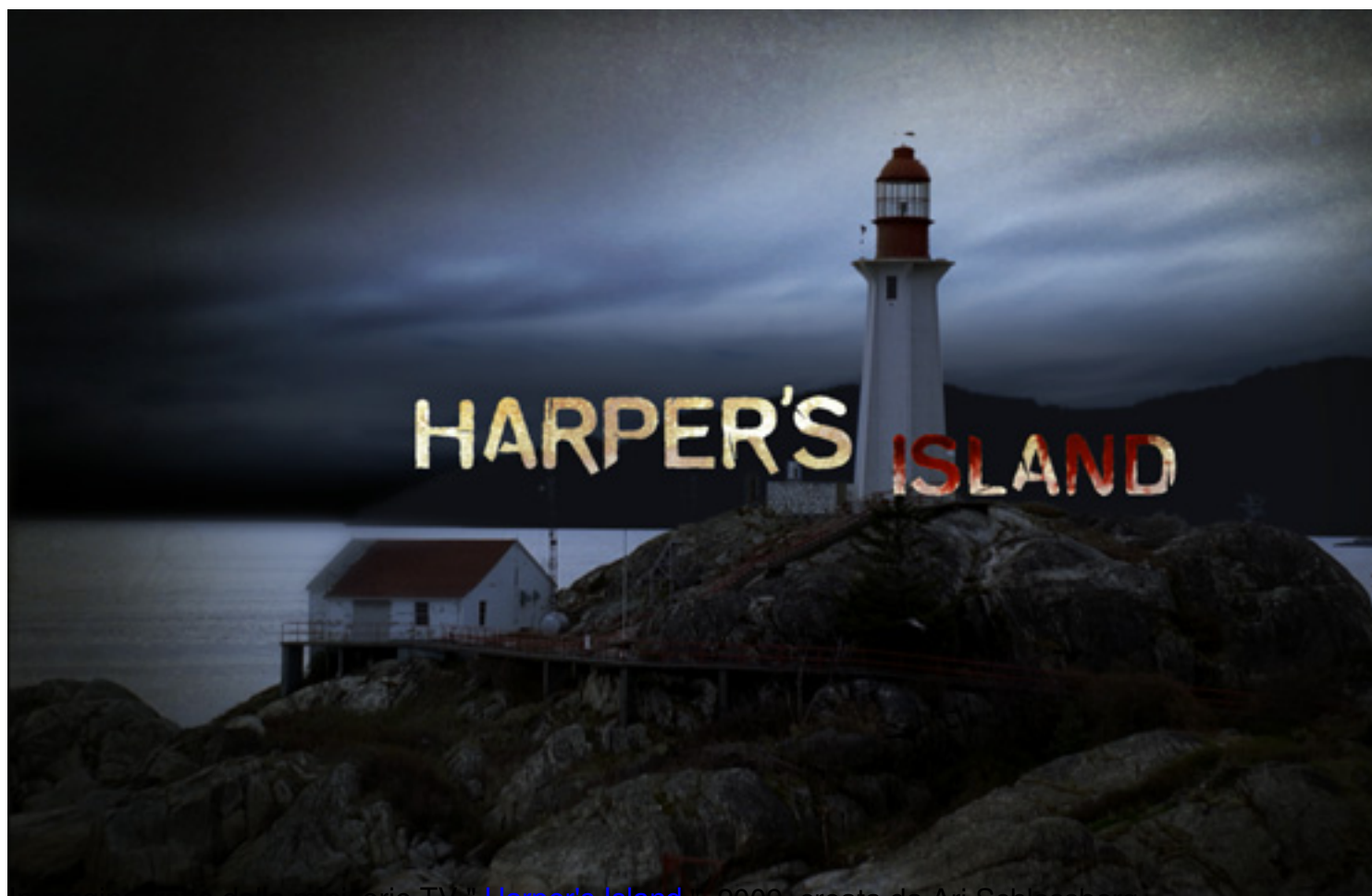
immagine tratta dalla miniserie TV Harper's Island , 2009, creata da Ari Schlossberg

Clicca qui sotto per vedere una galleria di poster e recensioni di film nella mia fan-page su facebook: