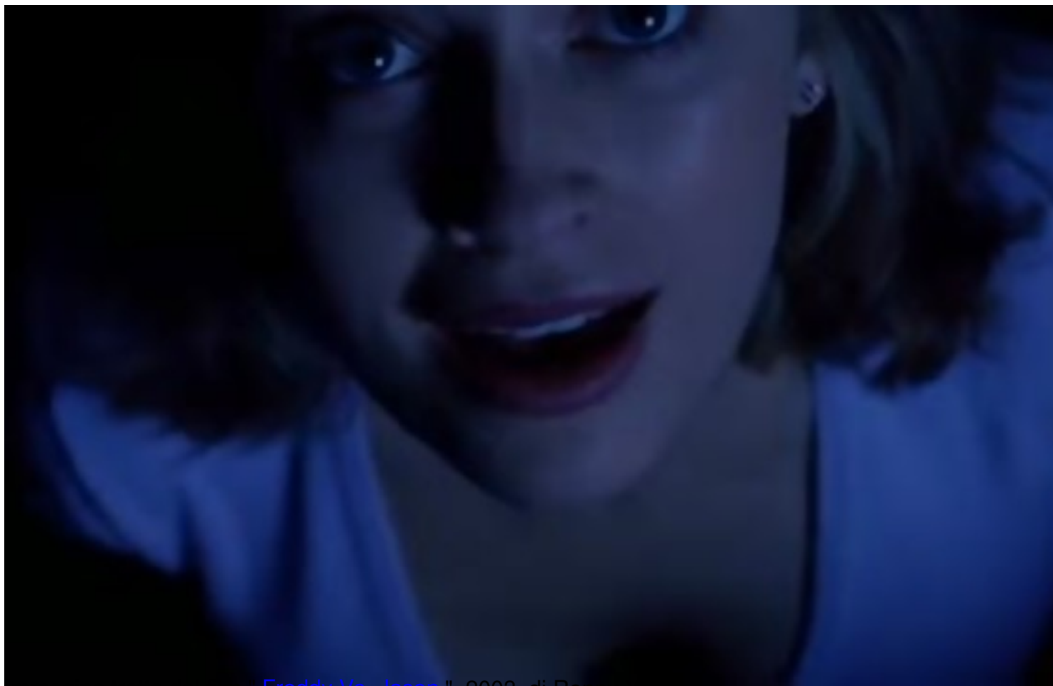
immagine tratta da film "Freddy Vs. Jason" , 2003, di Ronny Yu

Clicca qui sotto per vedere una galleria di poster e recensioni di film nella mia fan-page su facebook: