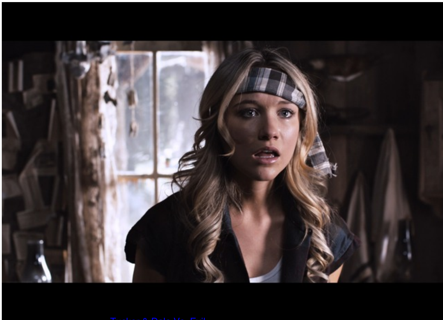
Immagine tratta dal film Tucker & Dale Vs. Evil , 2010, di Eli Craig.

Clicca qui sotto per vedere una galleria di poster e recensioni di film nella mia fan-page su facebook: