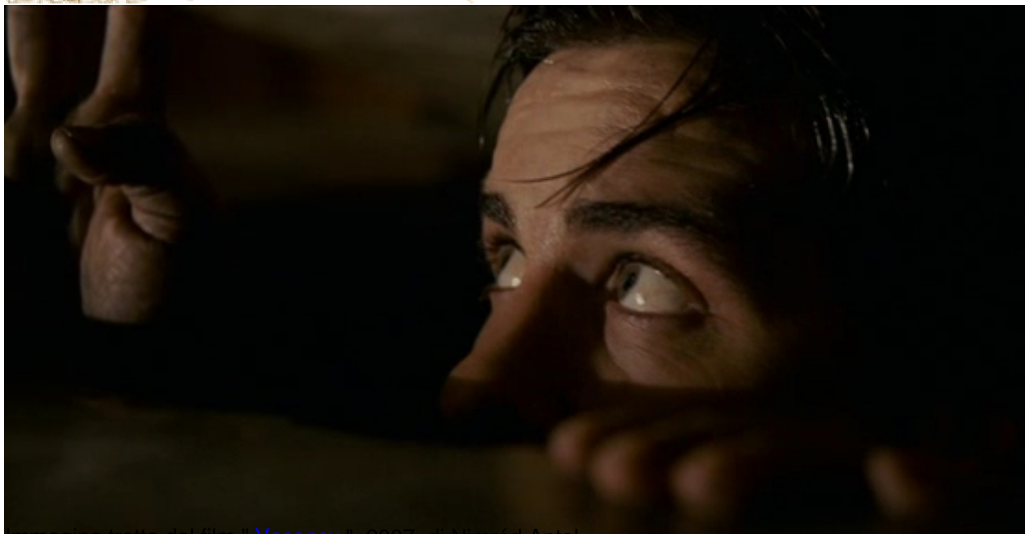
Immagine tratta dal film Vacancy , 2007, di Nimrod Antal

Clicca qui sotto per vedere una galleria di poster e recensioni di film nella mia fan-page su facebook: