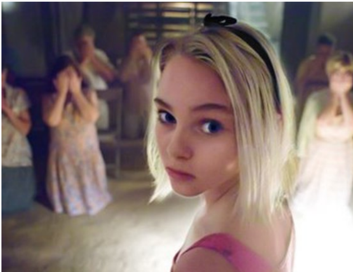
Immagine tratta dal film " I Segni Del Male ", 2007, di Stephen Hopkins

Clicca qui sotto per vedere una galleria di poster e recensioni di film nella mia fan-page su facebook: