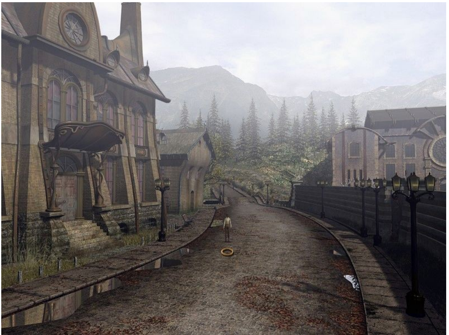
Immagine tratta dal video game ' Syberia ', 2002, di Benoit Sokal