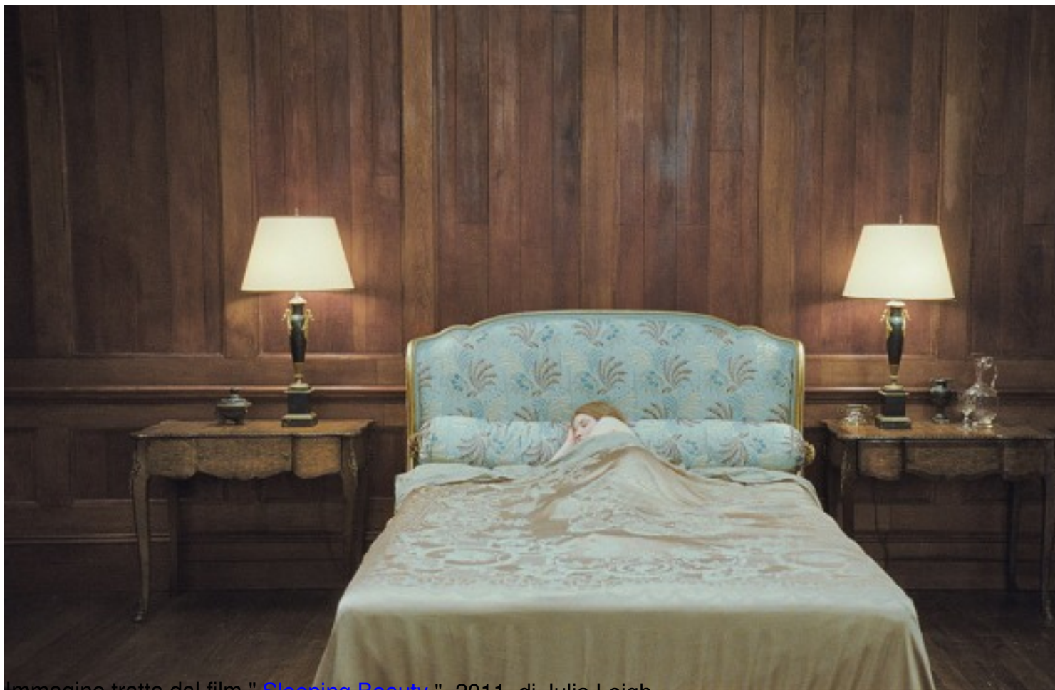
Immagine tratta dal film " Sleeping Beauty ", 2011, di Julia Leigh

Clicca qui sotto per vedere una galleria di poster e recensioni di film nella mia fan-page su facebook: