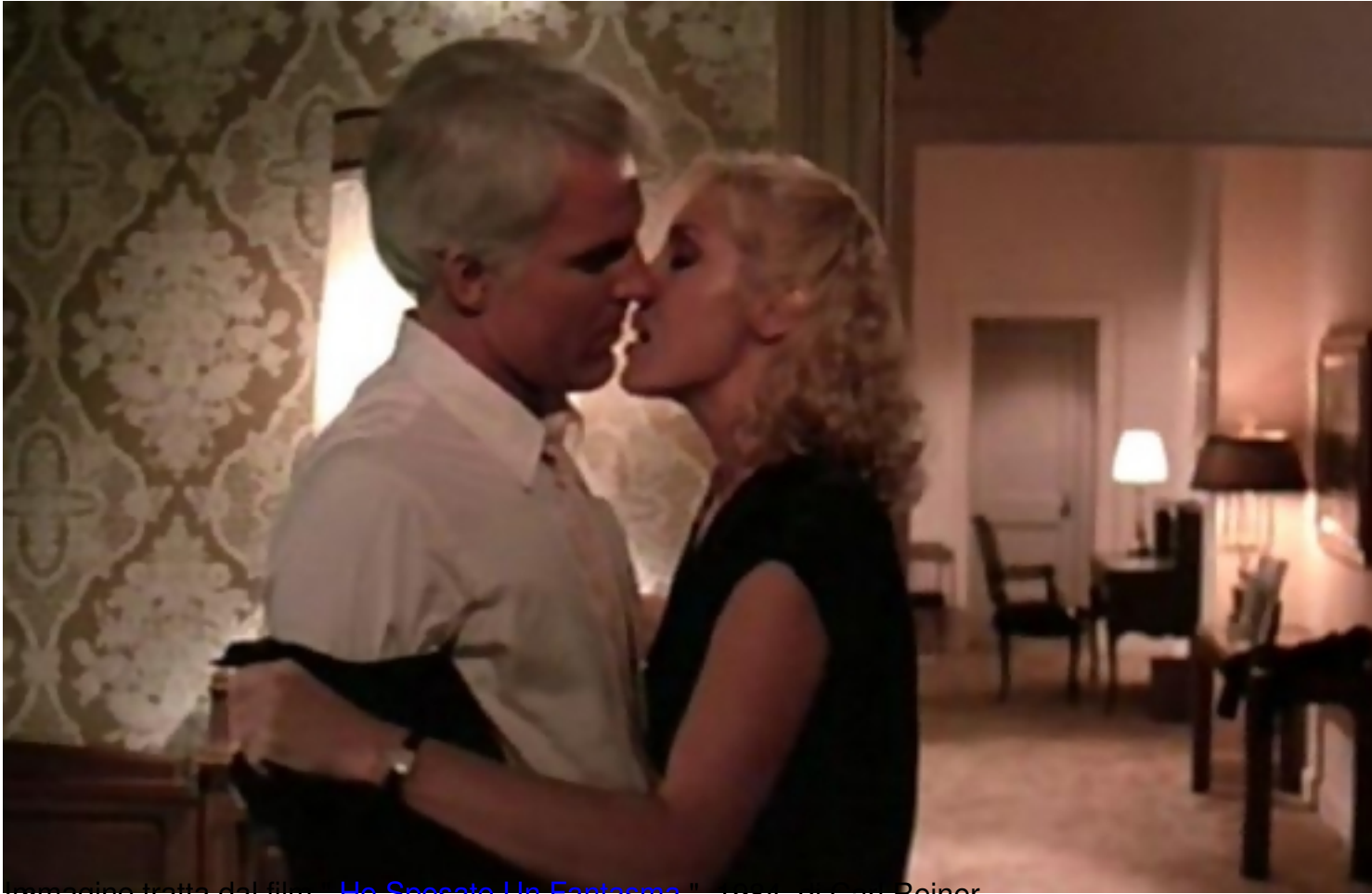
immagine tratta dal film "Ho Sposato Un Fantasma" , 1964, di Carl Reiner

Clicca qui sotto per vedere una galleria di poster e recensioni di film nella mia fan-page su facebook: