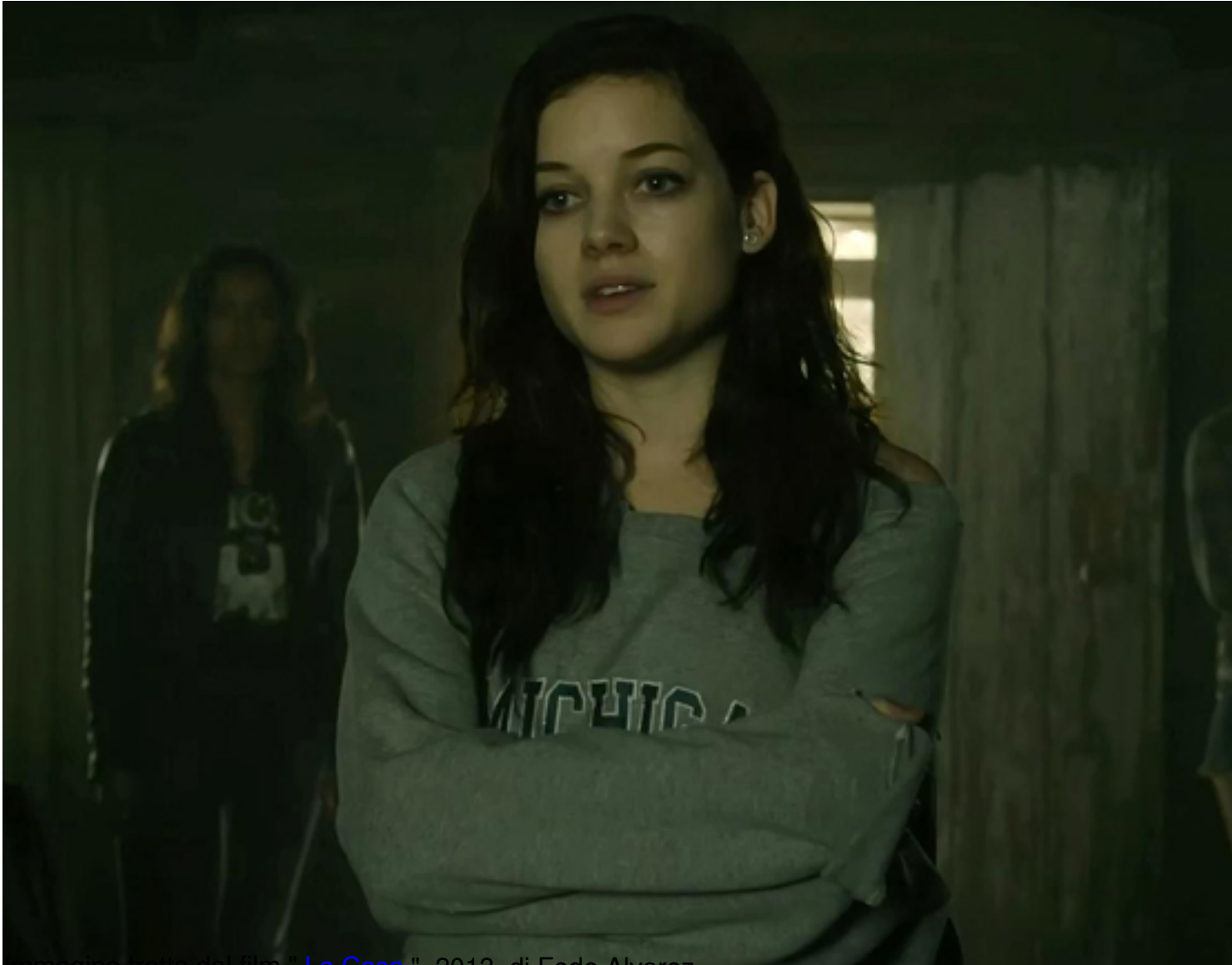
Immagine tratta dal film " La Casa ", 2013, di Fede Alvarez

Clicca qui sotto per vedere una galleria di poster e recensioni di film nella mia fan-page su facebook: