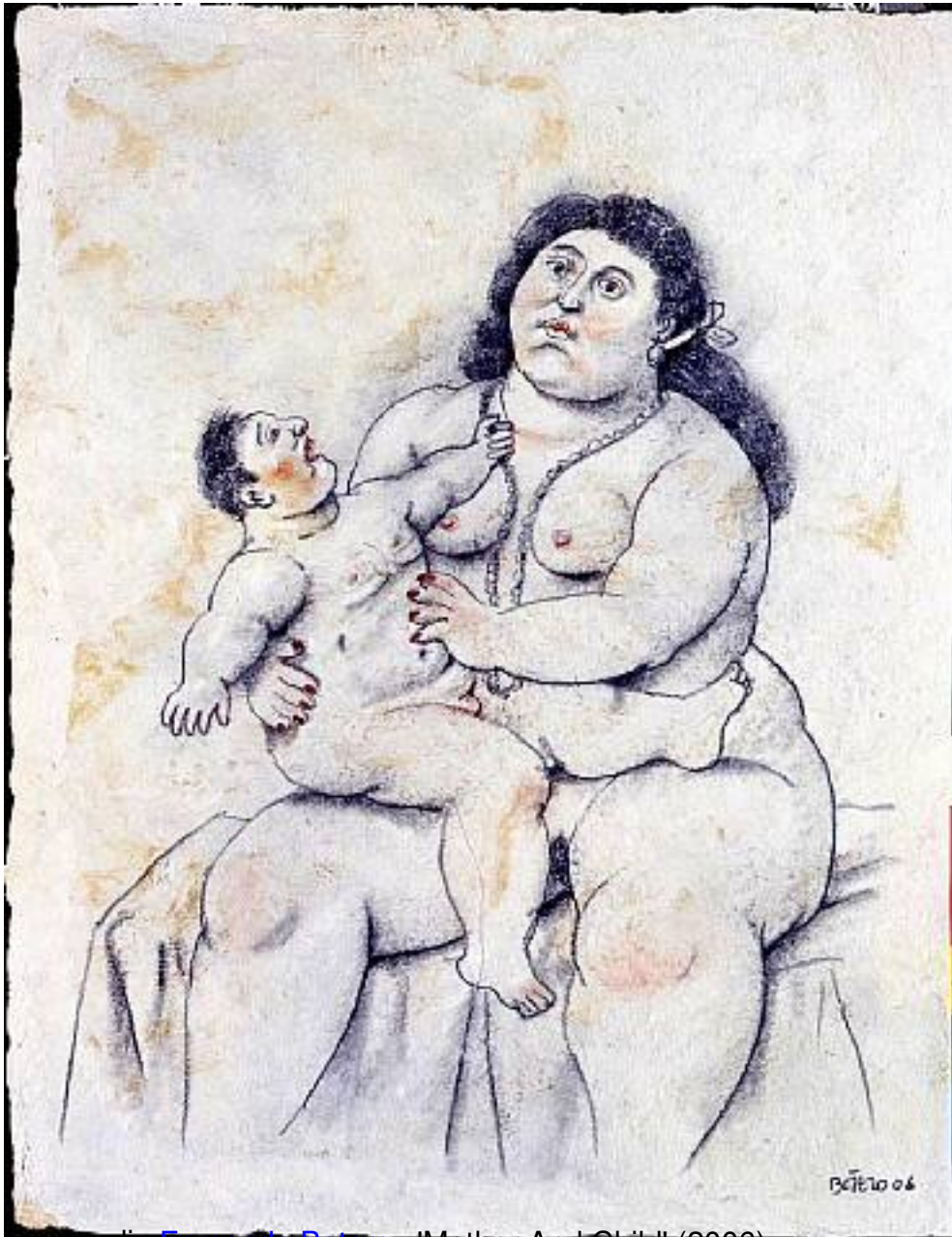
Dipinto di Fernando Botero , 'Mother And Child' (2006)

Clicca qui sotto per vedere una galleria di opere di Fernando Botero nella mia fan-page su facebook: