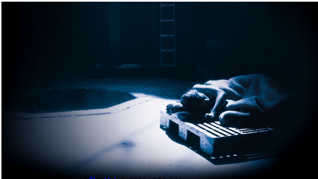
immagine tratta dal film The Hole , 2001, di Nick Hamm

Clicca qui sotto per vedere una galleria di poster e recensioni di film nella mia fan-page su facebook: