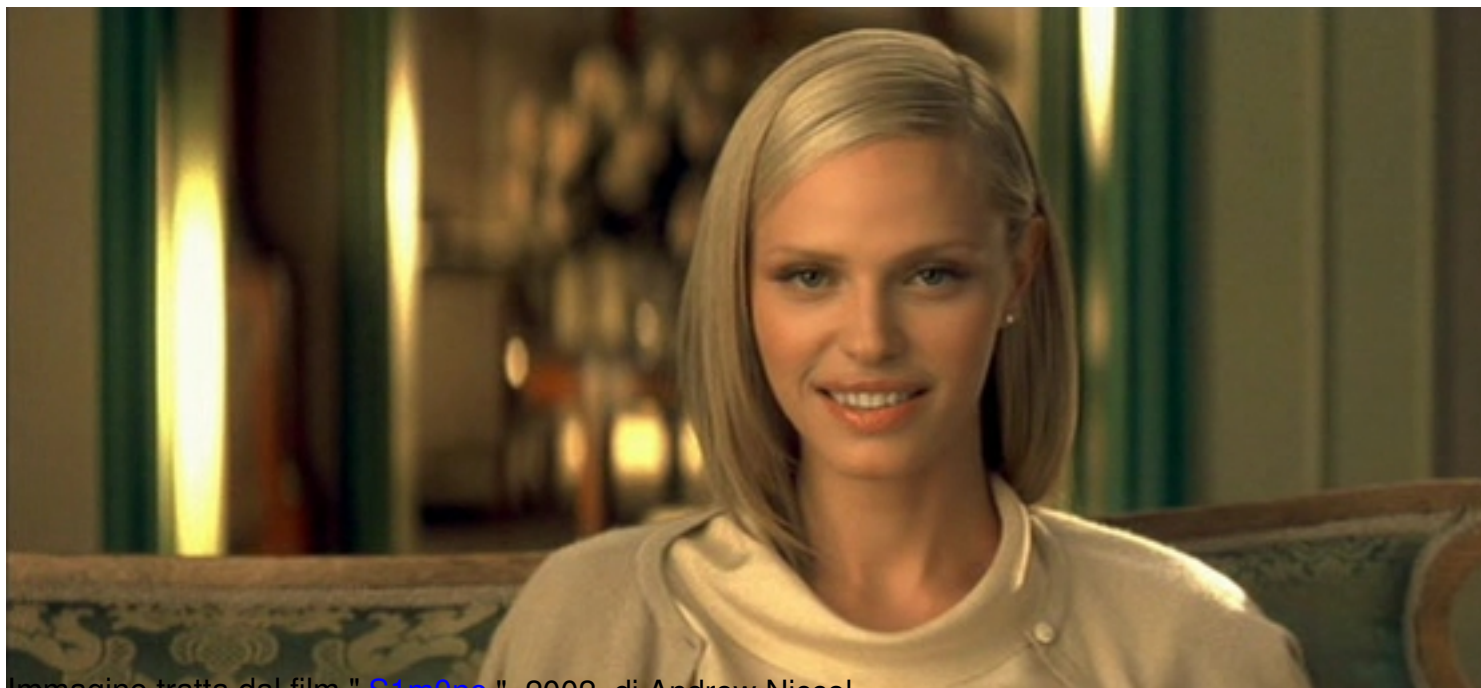
Immagine tratta dal film " Simone ", 2002, di Andrew Niccol

Clicca qui sotto per vedere una galleria di poster e recensioni di film nella mia fan-page su facebook: