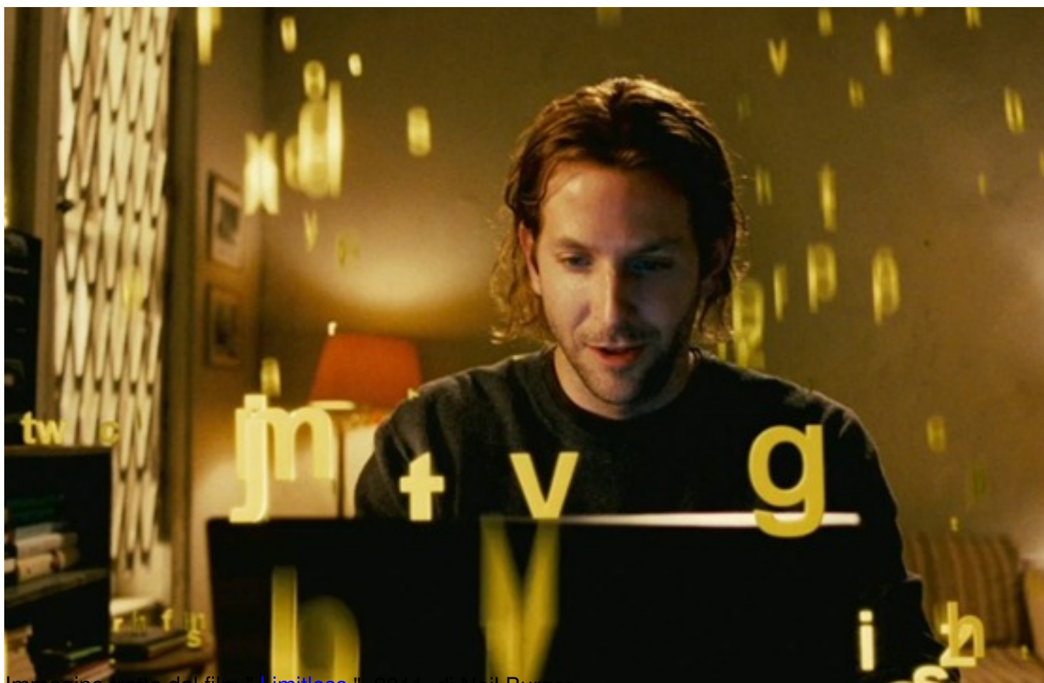
Immagine tratta dal film "Limitless" , 2011, di Neil Burger

Clicca qui sotto per vedere una galleria di poster e recensioni di film nella mia fan-page su facebook: