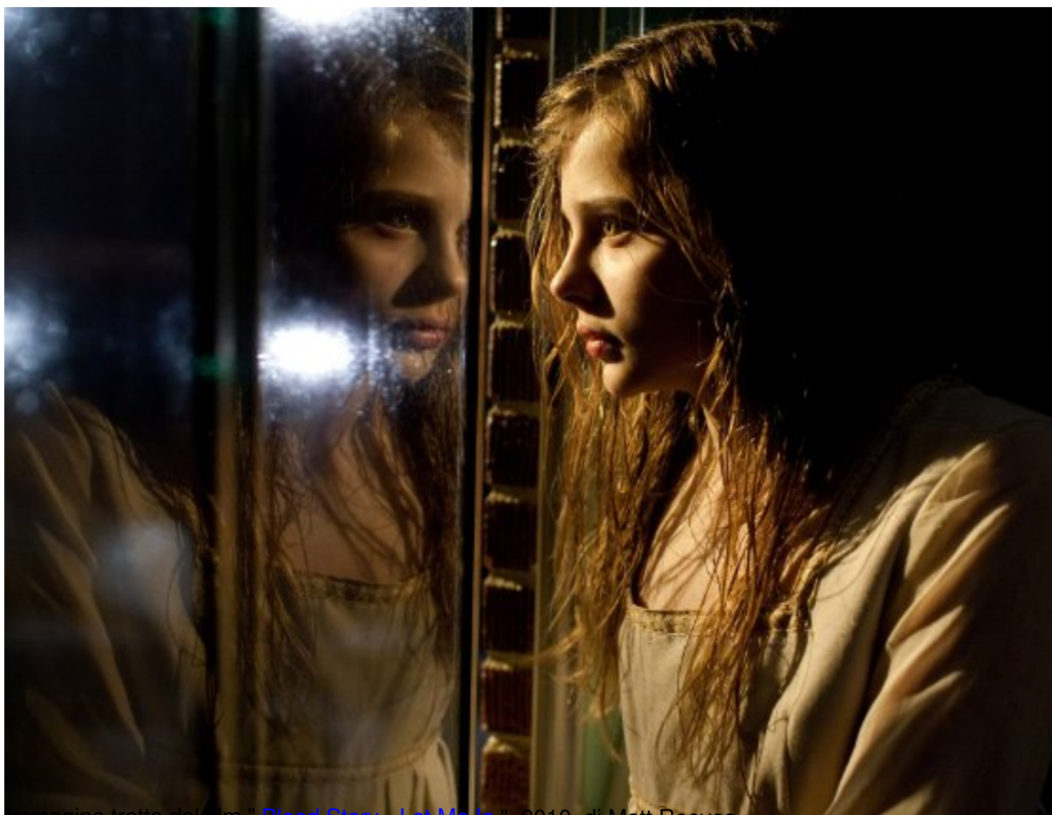
immagine tratta dal film Blood Story - Let Me In , 2010, di Matt Reeves

Clicca qui sotto per vedere una galleria di poster e recensioni di film nella mia fan-page su facebook: