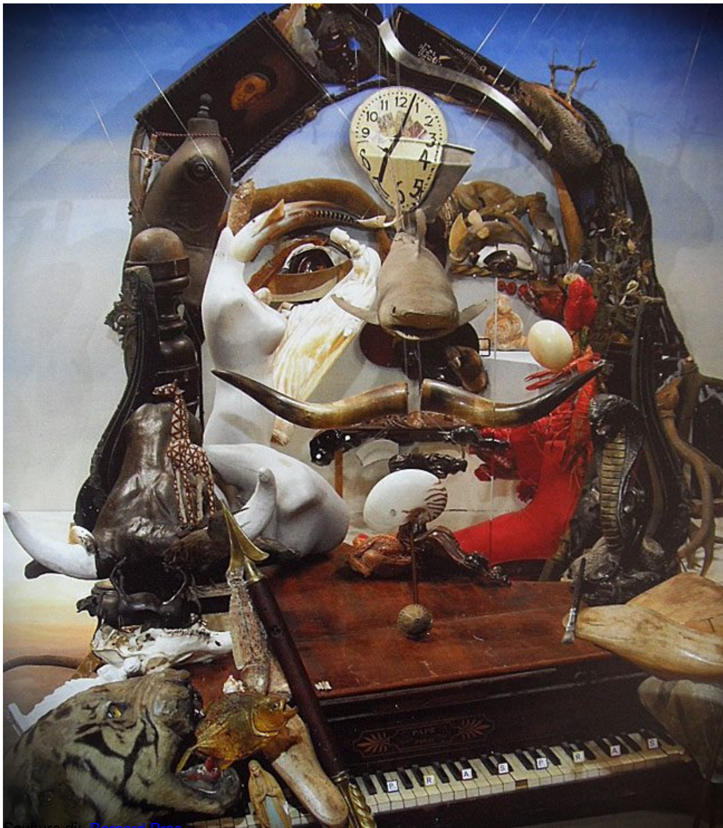
Scultura di: Bernard Pras

Cliccà qui sotto per vedere una galleria di opere di Bernard Pras nella mia fan-page su facebook: