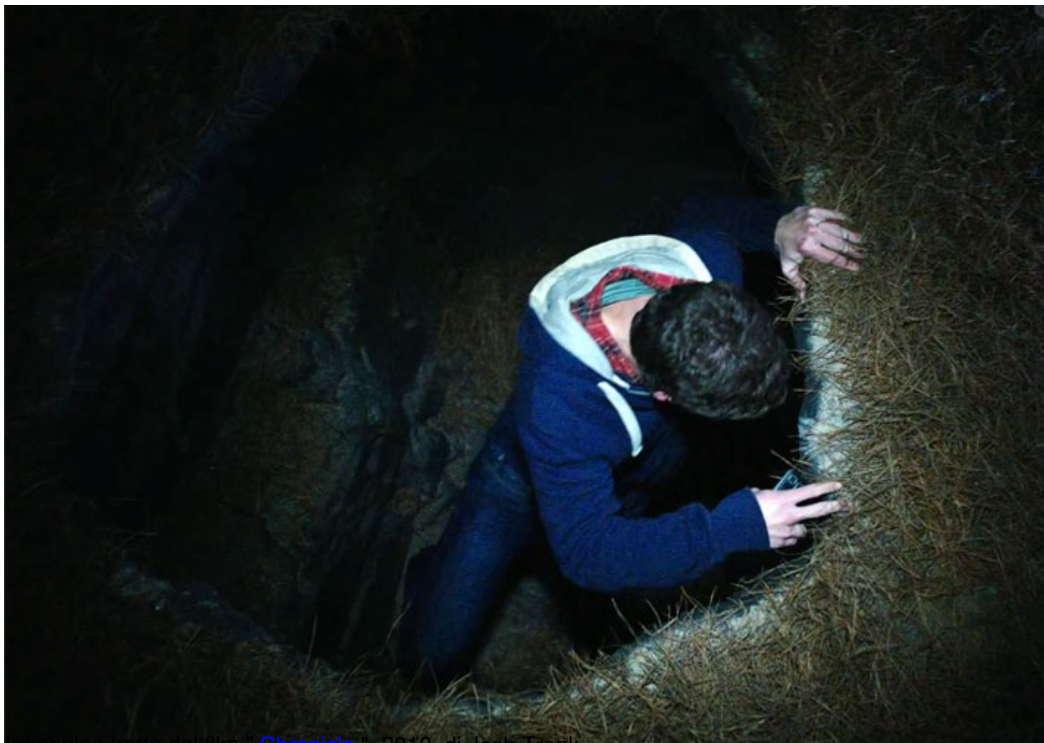
immagine tratta dal film " Chronicle ", 2012, di Josh Trank

Clicca qui sotto per vedere una galleria di poster e recensioni di film nella mia fan-page su facebook: