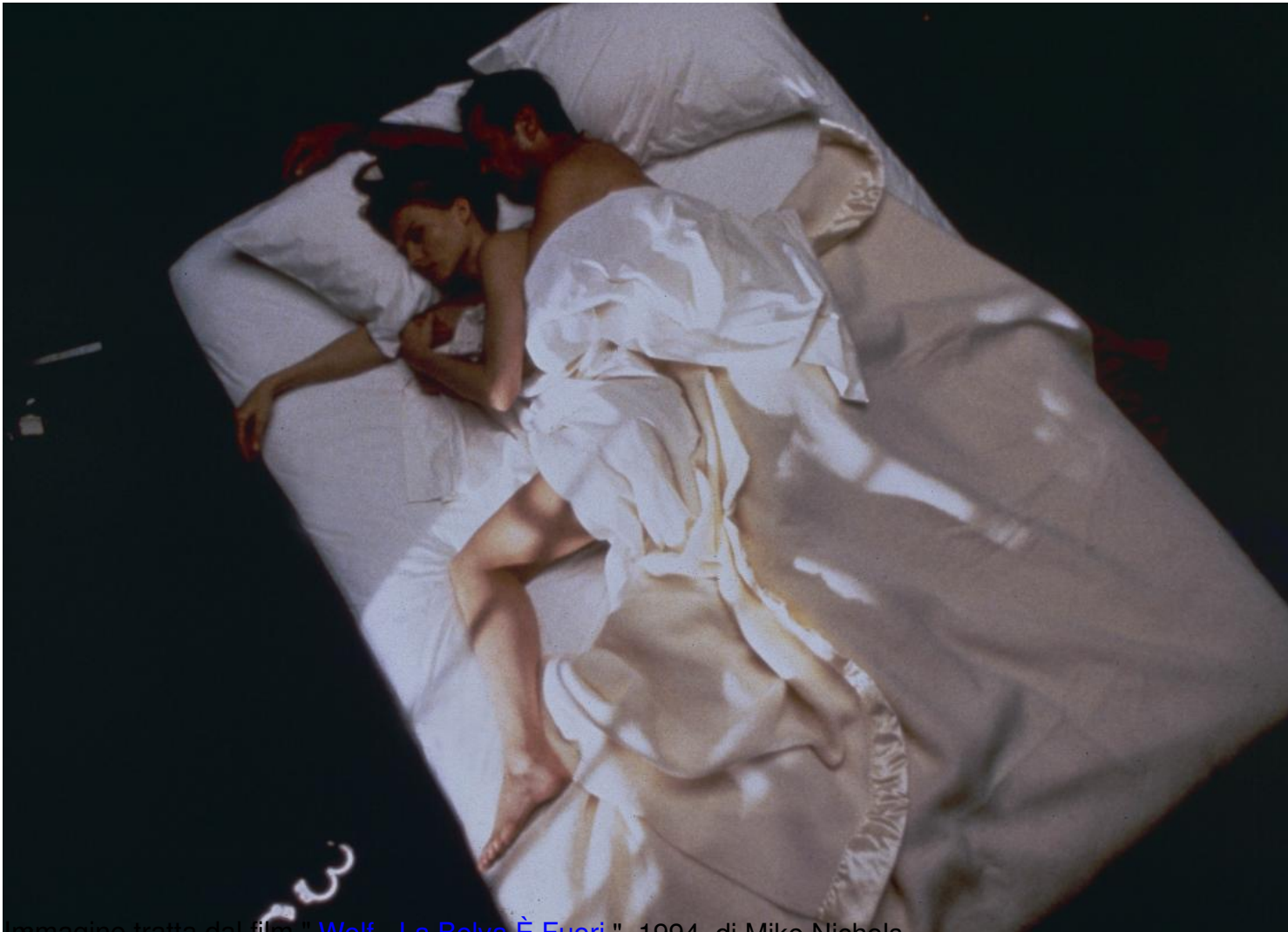
Immagine tratta dal film " Wolf - La Belva È Fuori ", 1994, di Mike Nichols

Clicca qui sotto per vedere una galleria di poster e recensioni di film nella mia fan-page su facebook: