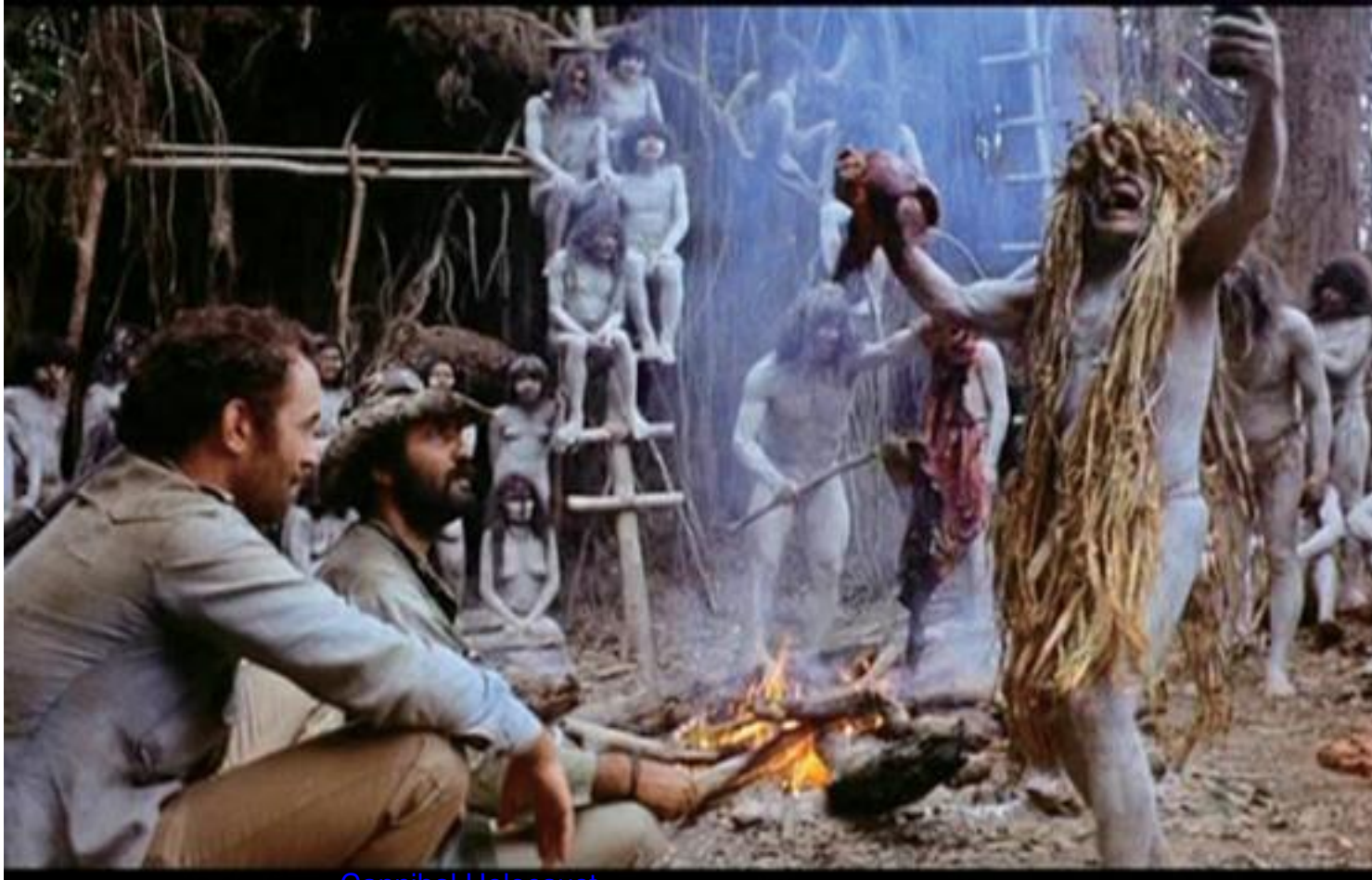
Immagine tratta dal film Cannibal Holocaust , 1980, di Ruggero Deodato

Clicca qui sotto per vedere una galleria di poster e recensioni di film nella mia fan-page su facebook: