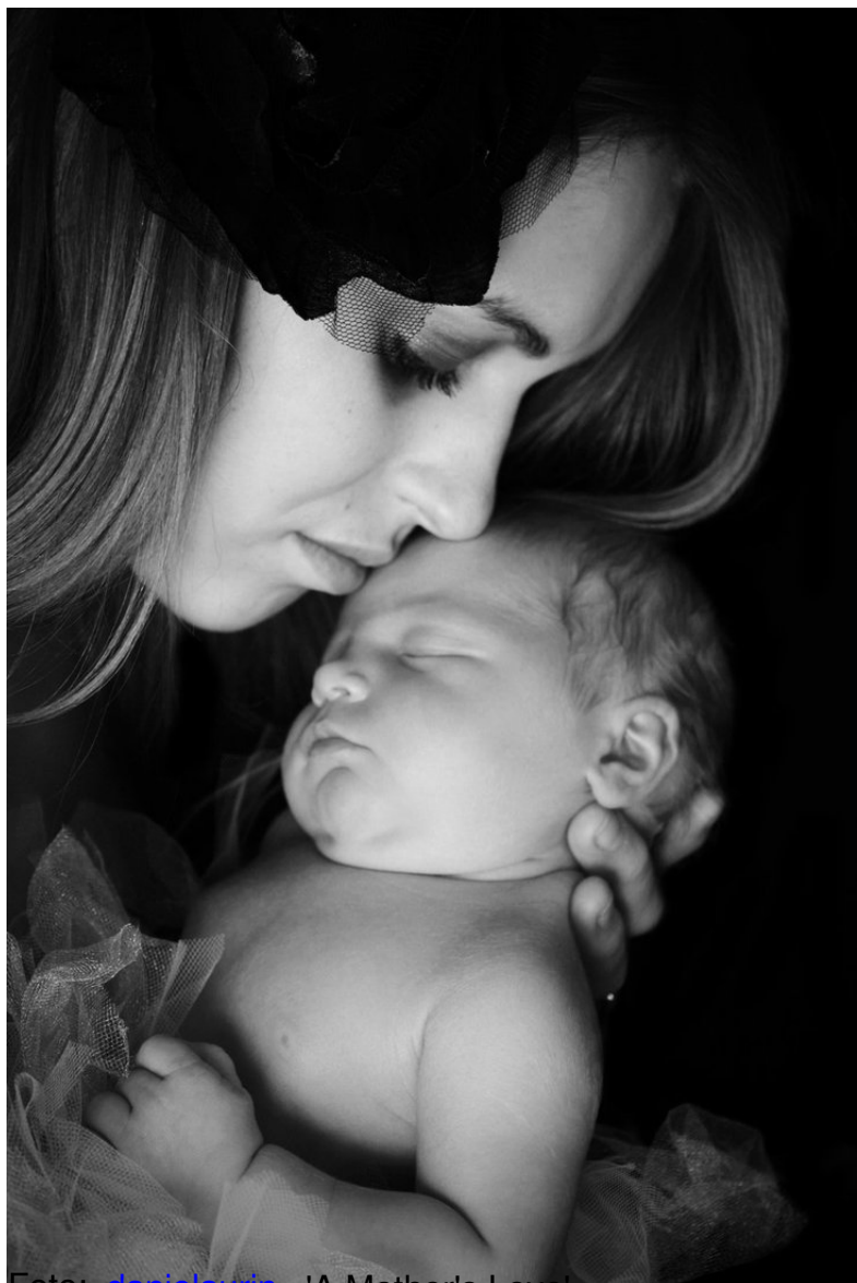
'A Mother's Love'