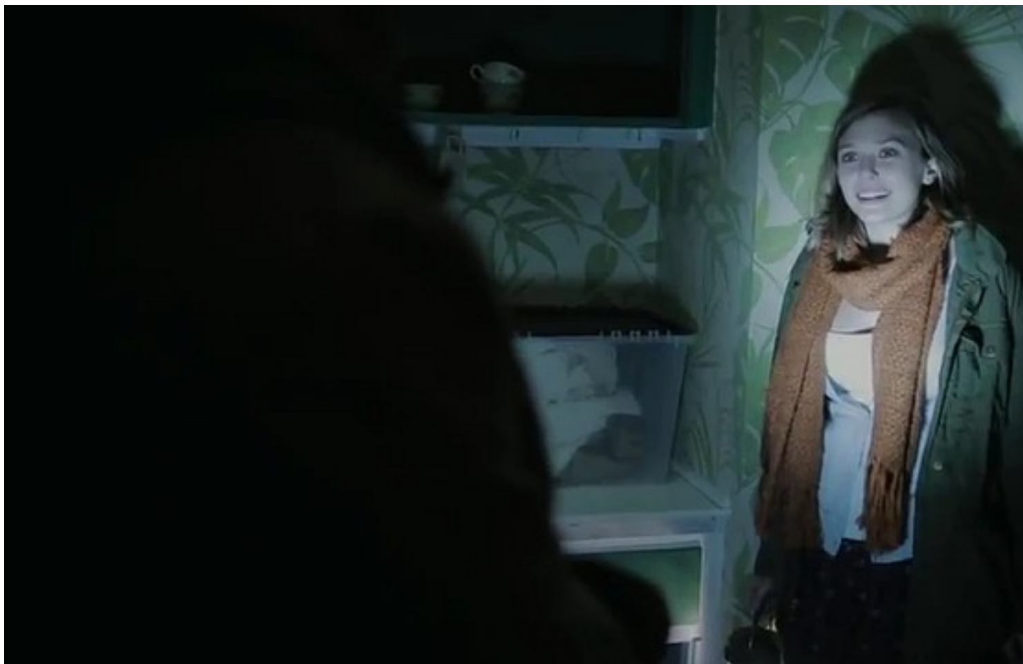
Immagine tratta dal film " Silent House ", 2011, di Chris Kentis & Laura Lau

Clicca qui sotto per vedere una galleria di poster e recensioni di film nella mia fan-page su facebook: