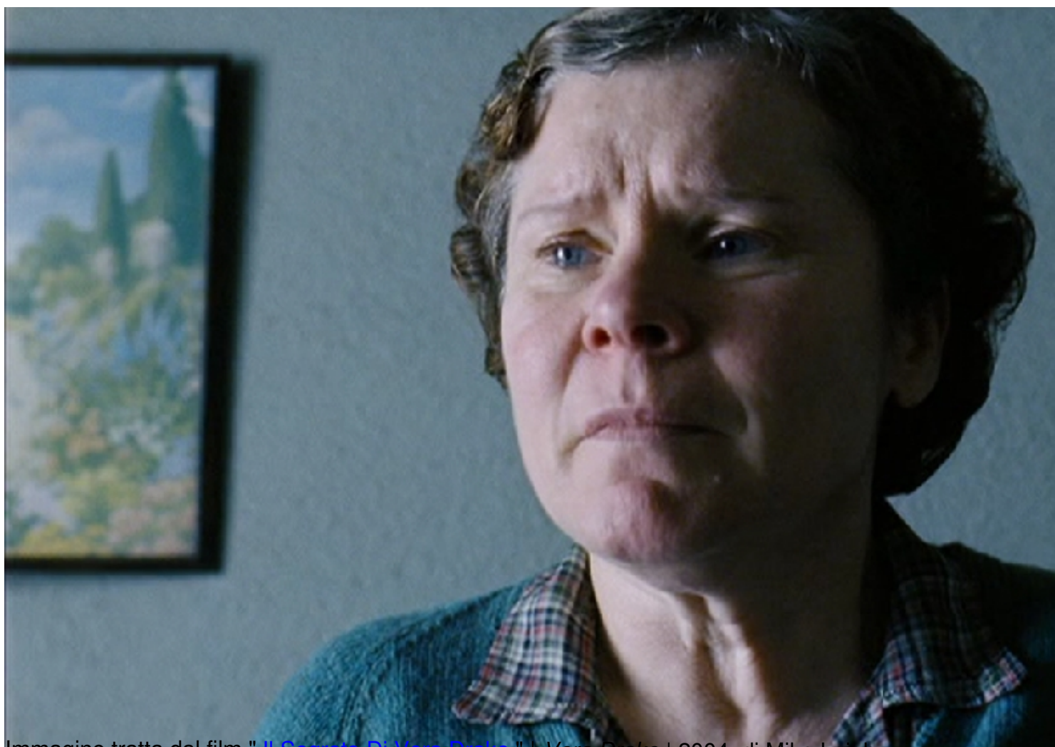
Immagine tratta dal film " Il Segreto Di Vera Drake " | Vera Drake | 2004, di Mike Leigh

Clicca qui sotto per vedere una galleria di poster e recensioni di film nella mia fan-page su facebook: