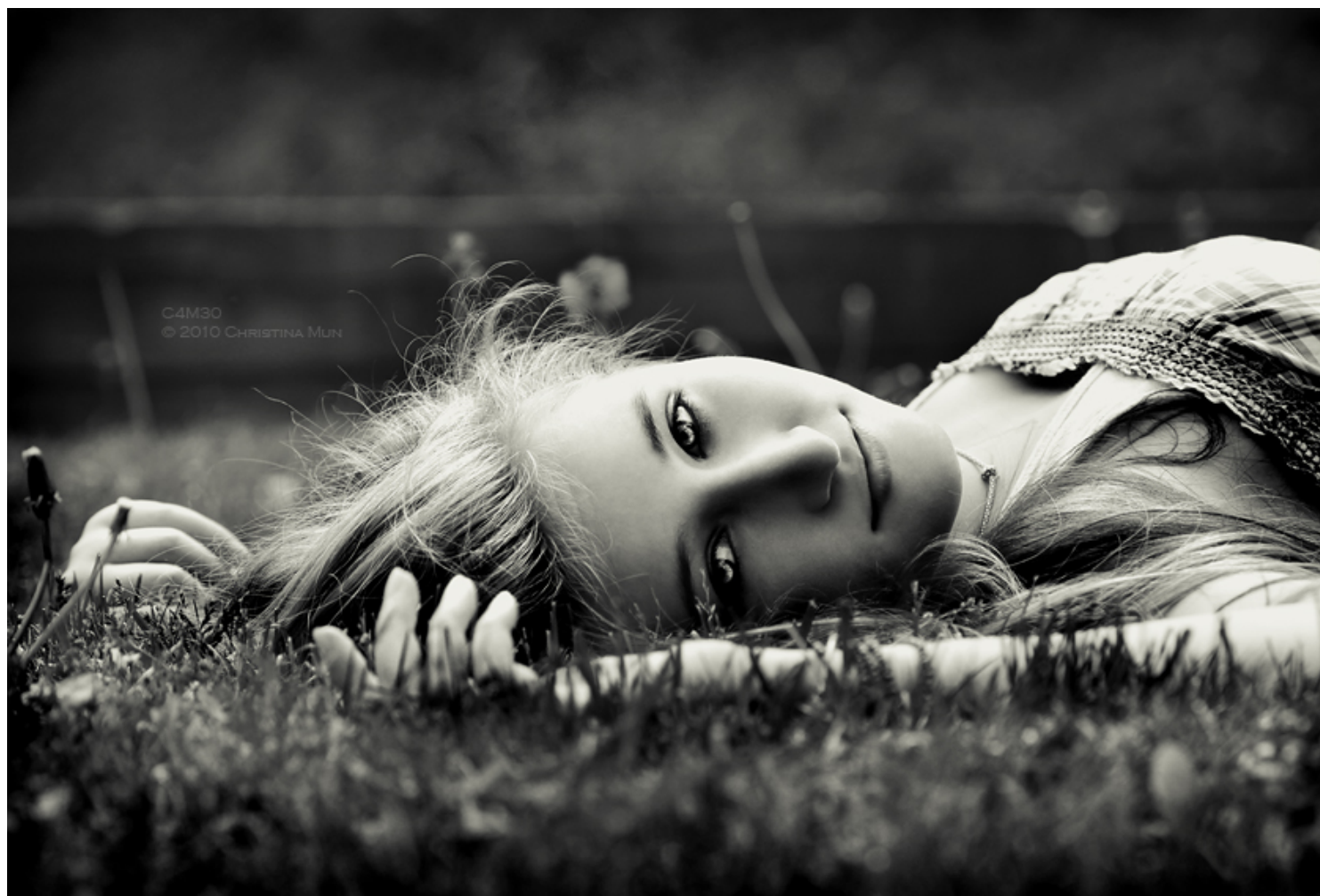
'the wolf in her eyes.'