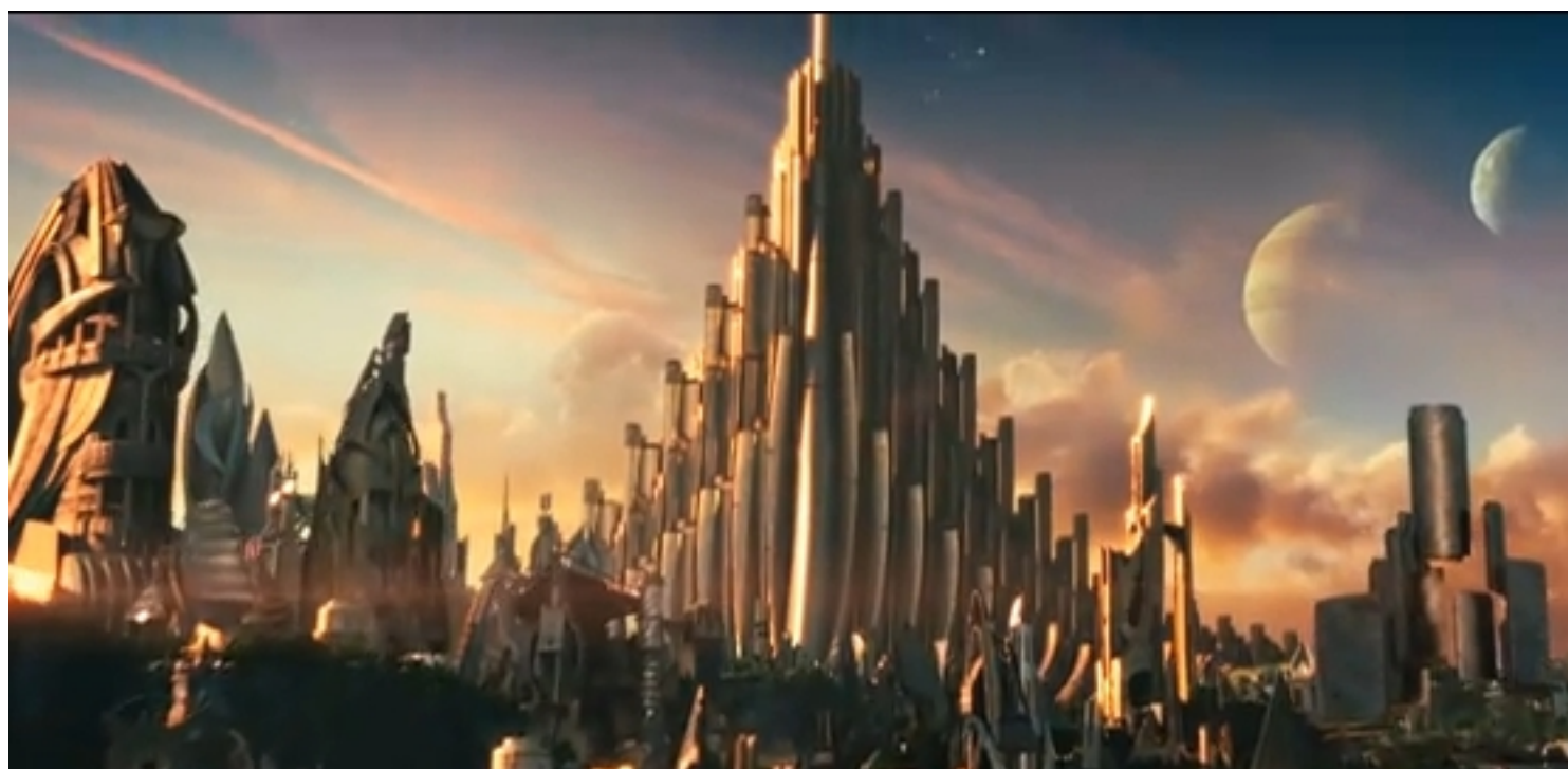
Immagine tratta dal film " Thor ", 2011, di Kenneth Branagh

Clicca qui sotto per vedere una galleria di poster e recensioni di film nella mia fan-page su facebook: