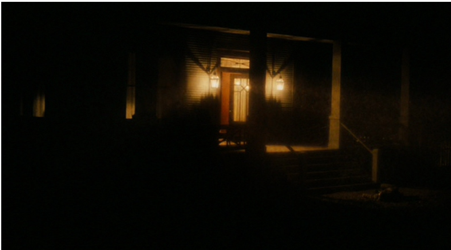
Immagine tratta dal film " True Grit - Il Grinta ", 2010, di Joel Coen & Ethan Coen

Clicca qui sotto per vedere una galleria di poster e recensioni di film nella mia fan-page su facebook: