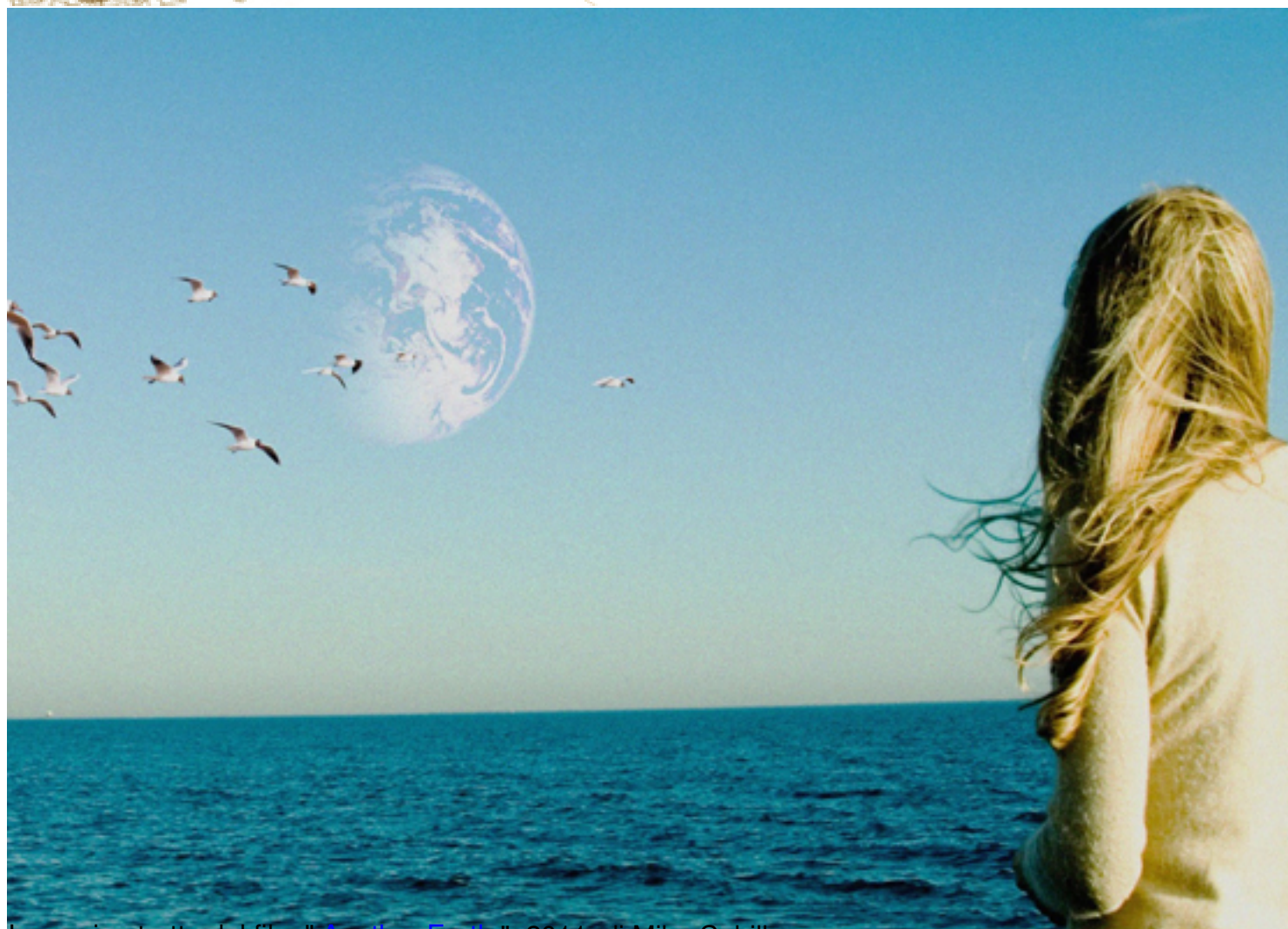
Immagine tratta dal film " Another Earth ", 2011, di Mike Cahill

Clicca qui sotto per vedere una galleria di poster e recensioni di film nella mia fan-page su facebook: