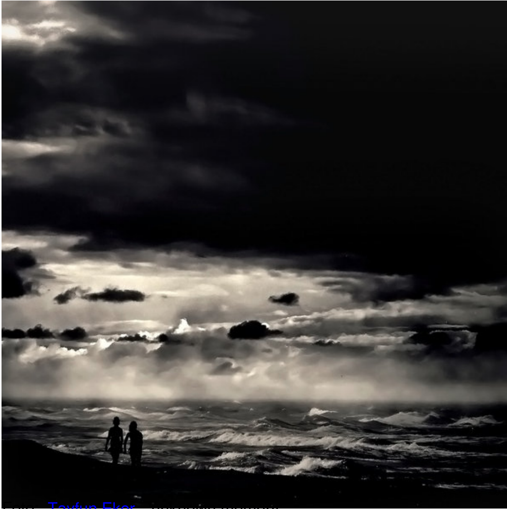
unknown memory