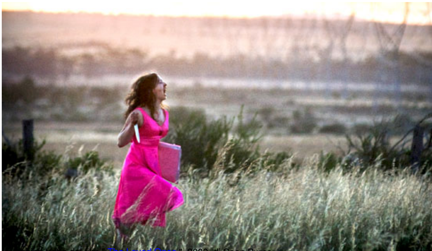
immagine tratta dal film "The Loved Ones" , 2009, di Sean Byrne

Clicca qui sotto per vedere una galleria di poster e recensioni di film nella mia fan-page su facebook: