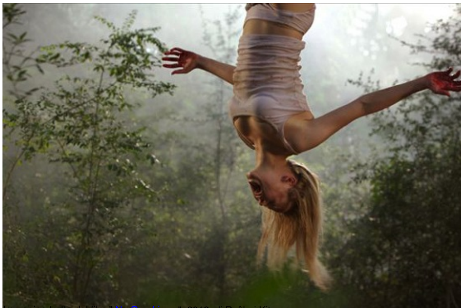
Immagine tratta dal film " No One Lives ", 2012, di Ryûhei Kitamura.

Clicca qui sotto per vedere una galleria di poster e recensioni di film nella mia fan-page su facebook: