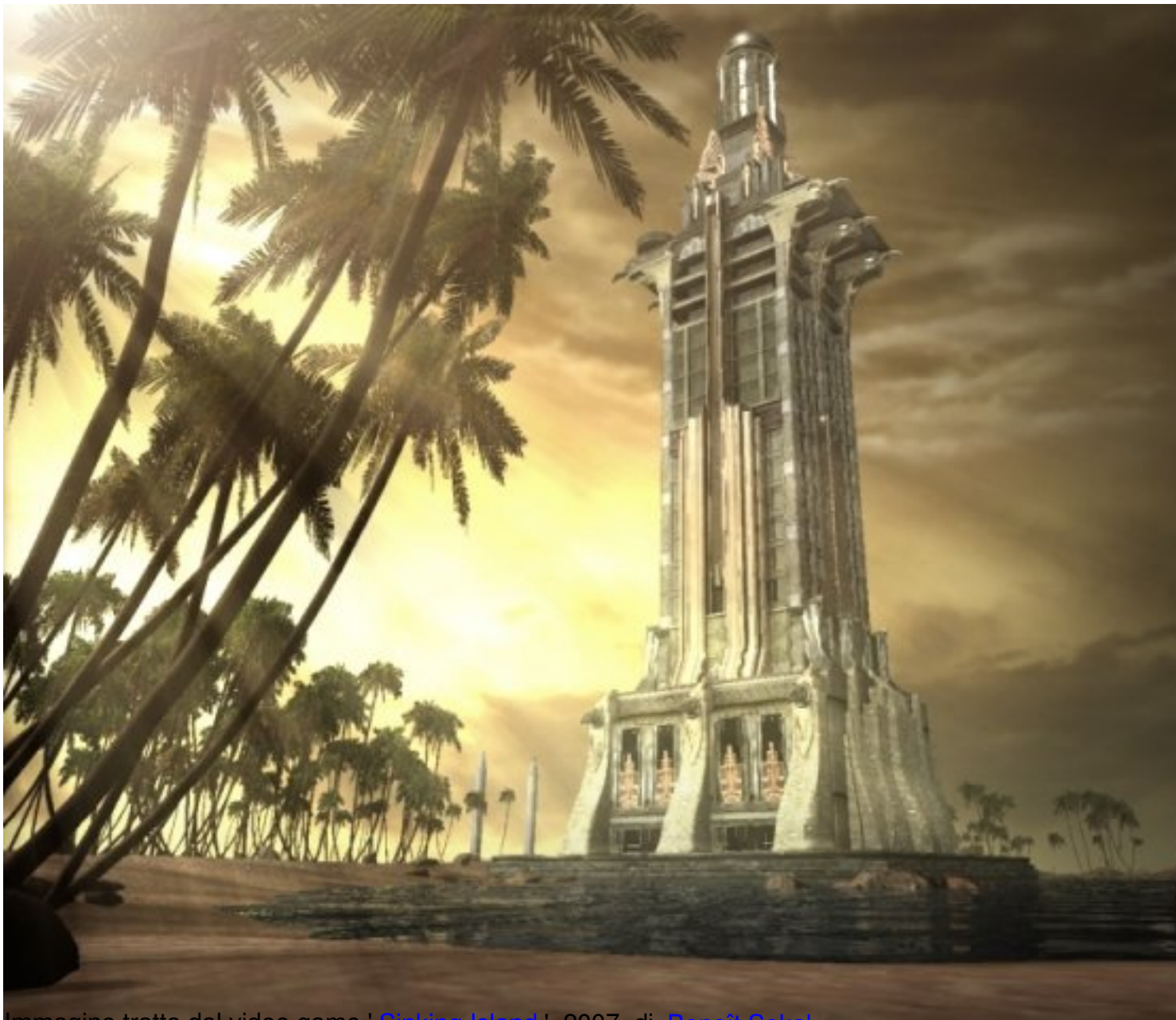
Immagine tratta dal video game ' Sinking Island ', 2007, di Benoit Sokal

Clicca qui sotto per vedere una galleria di video games (a cui ho giocato) nella mia fan-page su facebook: