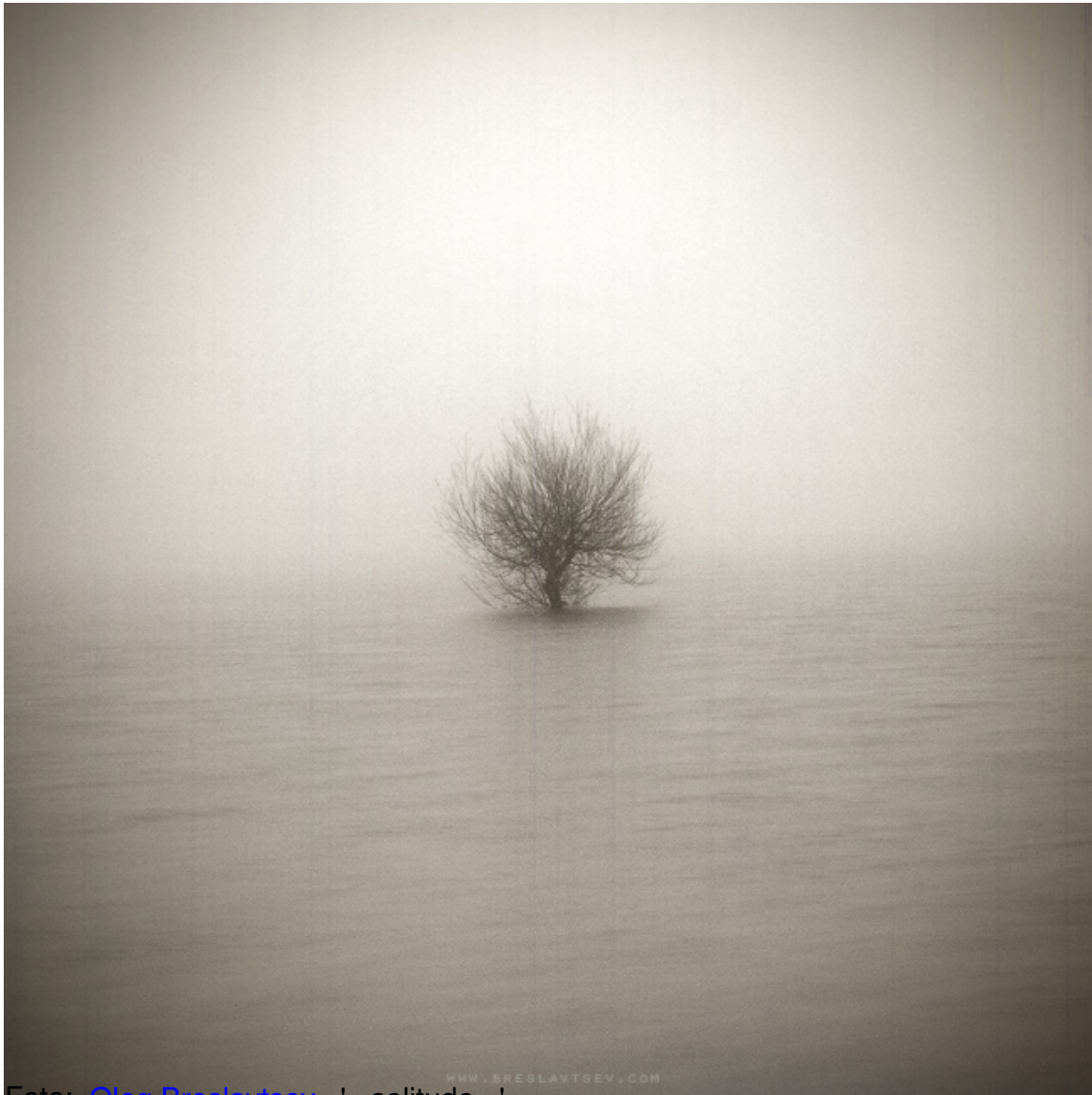
'...solitude...'