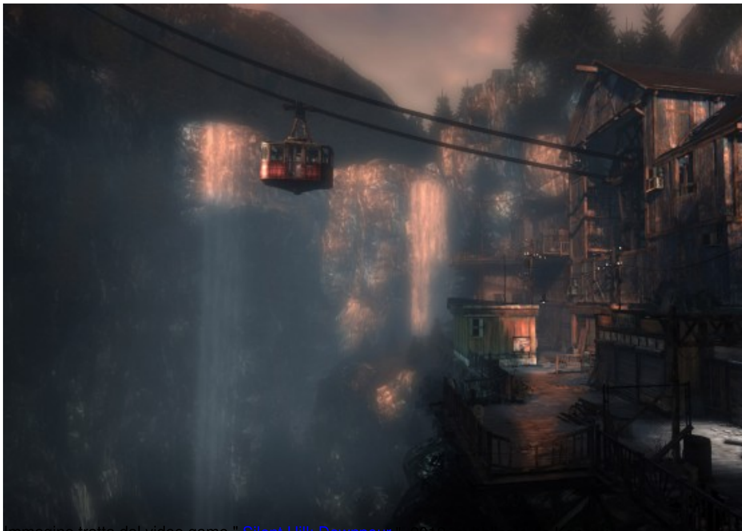
Immagine tratta dal video game " Silent Hill: Downpour ", 2012, pubblicato da Konami. Clicca qui sotto per vedere una galleria di video games (a cui ho giocato) nella mia fan-page su facebook: